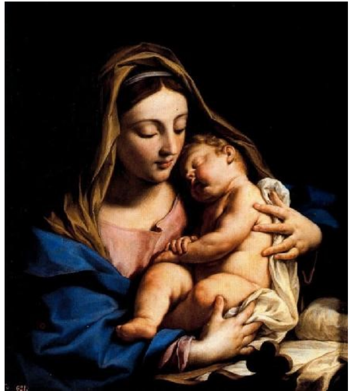
Leonardo Da Vinci: Jomfruen og barnet