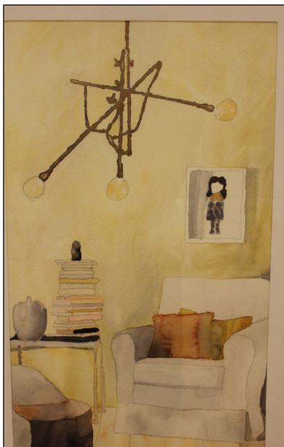
Akvarell laget av Håkon Berg Dybvik