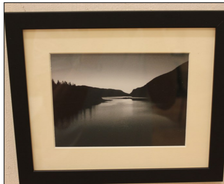
Helen Gutvik Grande: Fotografi