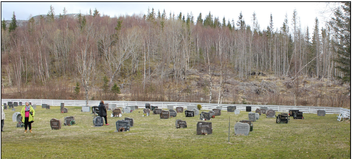
Fra Bindalseidet gravplass