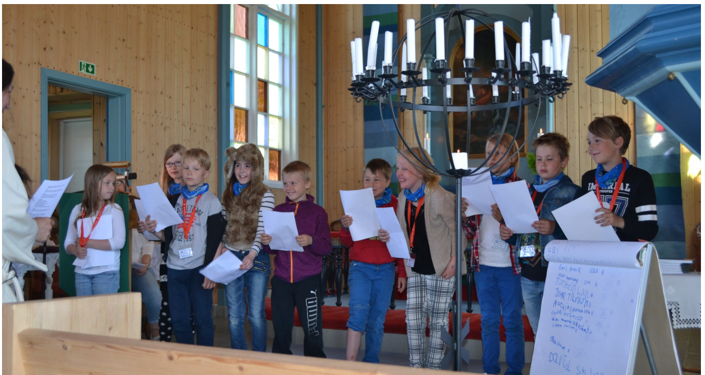
Fra Tårnagentgudstjenesten 5. juni i Solstad kirke