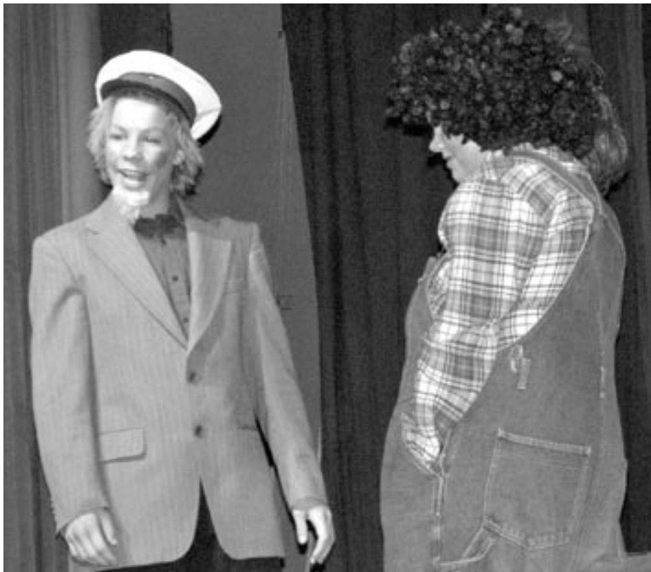
En driftig forretningsmann stod bak "Slarken pub og brukthandel"

Terråk skole feiret fredag 3. februar Skoleball, med god mat, polonese og deretter en god, gammeldags revy, med mange artige nummer.