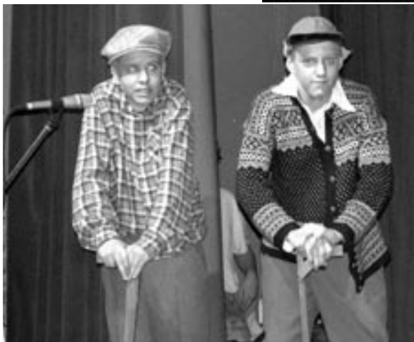
To eldre karer snakket forbi hverandre om problemer med vannet.