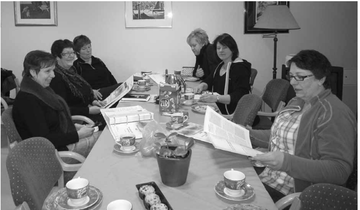
33 ansatte er delt i 4 grupper som møtes regelmessig. Kombinasjonen av teori og erfaring gjør at diskusjonene går, mens det samtidig blir tid til en kaffekopp, og latteren kan også høres innimellom. Her fra siste samling for en av studiegruppene, - to av gruppens medlemmer var ikke tilstede.