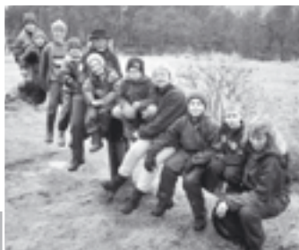
Harangsfjord skole (arkivbilde)

Undersøkelsen ble gjort i februar måned 2006