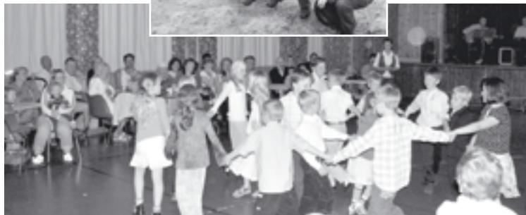
Barneskolen på Terråk skole hadde dans som tema på årets "Vårfest".