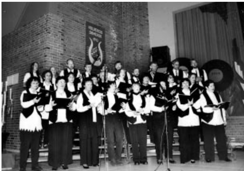
Songlaget i kulturhuset på Kolvreid midt på nittitallet. Da var det "Beatles" som stod på programmet.

Bindalseidet Songlag feirer 60-årsjubileum i år, og skal markere det med både alvor og skjemt. Songlaget ønsker seg tilbake til de tradisjonelle sangerfestene, og inviterer publikum til Bindalseidet fredag 15. mars, til Nye Vonheim lørdag 16. mars og til Breidablikk fredag 22. mars. En Sangerfest består av en seriøs og en lettere avdeling. Songlaget henter nå fram gamle revynumre og kjente slagere i en lett blanding. Vi gratulerer med jubileet!