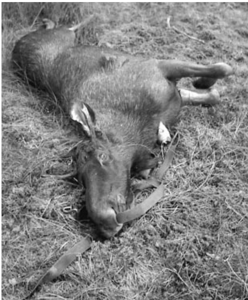
Fra elgjakta på Lysfjord sist høst.

Hvordan herredstyrelsen behandlet henvendelsen fra fogden er ikke kjent. Det kan imidlertid se ut for at den gode fogden ikke hadde full oversikt