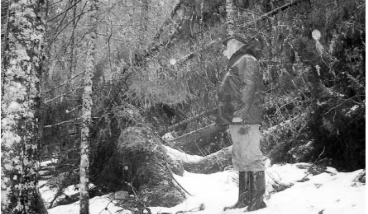
Skade på skogen ved Myren

Uværet i midten av januar medførte betydelig skade på skog, skogsveier og offentlige veier lenger nord på Helgeland. Det kan se ut for at Sør-Helgeland slapp noe billigere unna denne gangen men vi tar likevel med en liten orientering om ordningen med naturskadeerstatning.