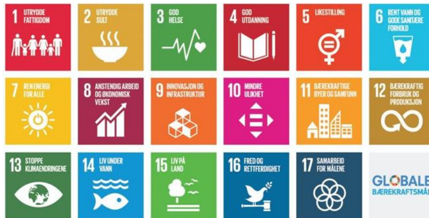
Figur 2: FN sine bærekraftsmål

For Bindal kommune vil det være viktig å aktivt tilrettelegge for å være et attraktivt sted å bo, arbeide, drive næring og besøke. Hva kan vi selv gjøre? Hva må vi samarbeide med andre om? FN sine bærekraftsmål vil være retningsgivende for å kunne ta tak i de største utfordringene i vår tid. Bindal kommune vil bruke FN sine bærekraftsmål aktivt i planleggingen. Arbeid på dette området som blir gjort nasjonalt og regionalt vil bli fulgt opp lokalt.