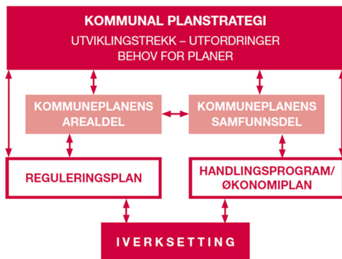
Figur 1: Planstrategien funksjon i plansystemet – basert på figur hentet fra Miljøverndepartementets veileder Planlegging etter plan og bygningsloven

Ved behandlingen skal kommunestyret ta stilling til om gjeldende kommuneplan eller deler av denne skal revideres, eller om planen skal videreføres uten endringer. Kommunestyret kan herunder ta stilling til om det er behov for å igangsette arbeid med nye arealplaner i valgperioden, eller om gjeldende planer bør revideres eller oppheves.