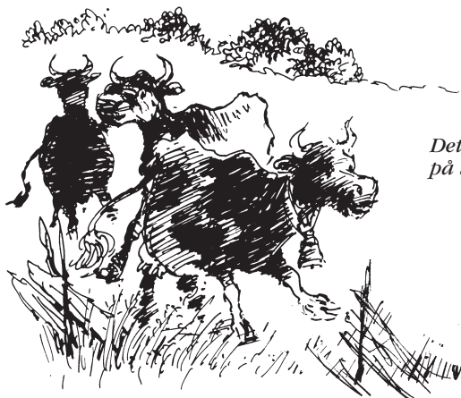
Det ble dyreskue på Skotnes