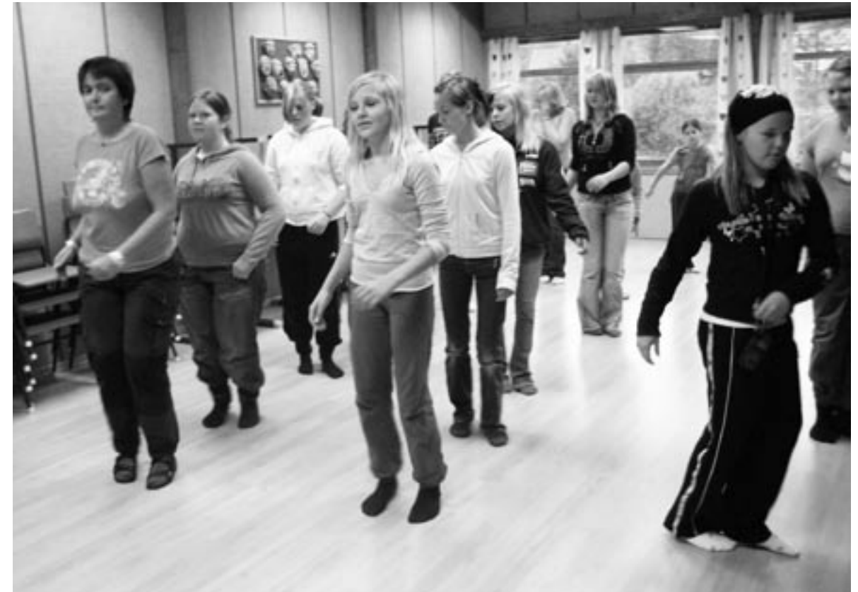
Hver dag er det fysisk aktivitet i 25 minutter i tillegg til de vanlige gym-timene. Med livat musikk til, er det et populært tilbud.

med. Gjett om det er populært! I tilknytning til skolelunsjen har lærerne "helsekvarten" der de kommer inn på viktigheten av fysisk aktivitet og kosthold.