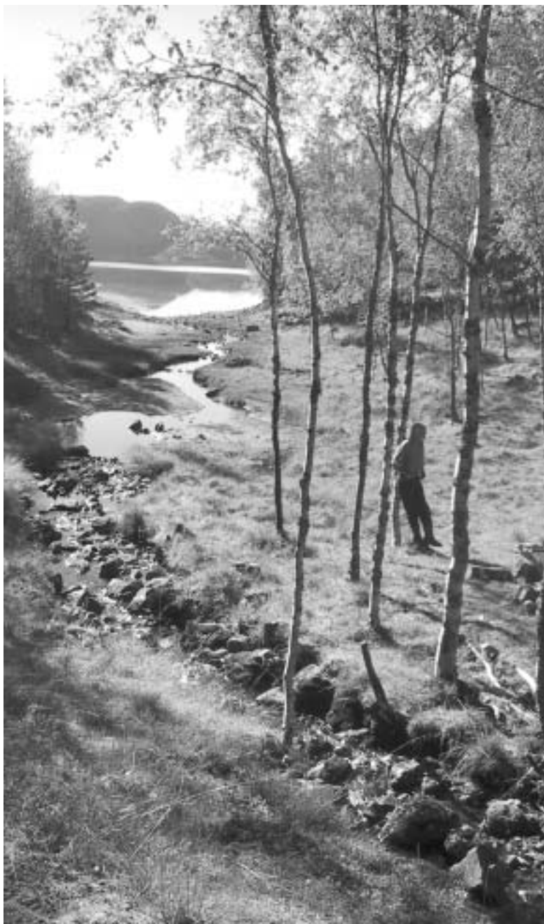
Fra Svarthopen i Harangsfjord