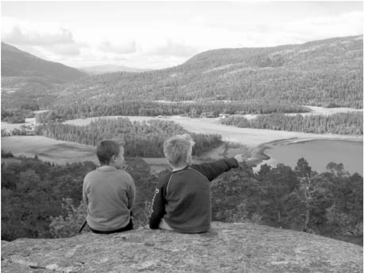
Utsikten fra Kommelåsen i Åbygda.