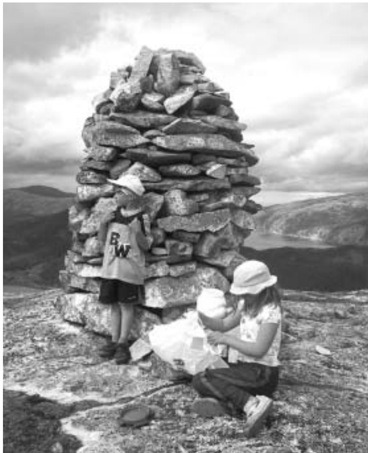
To turgåere på toppen av Mulingen.