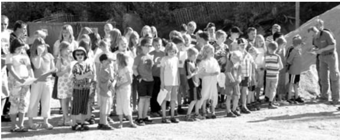
Alle elevene fra 1. til 7. klasse sang "Søppelsangen" på Miljøtorget.