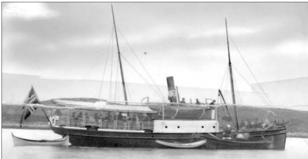
Torghatten Dampskipsselskab mente det var behov for flere båter enn «Torghatten», som her er avbildet.

Torghatten Dampskipssentral ber Bindal i lag med kommunene Vik, Vega, Brønnø og Velfjorden stille garanti for innkjøp av et nytt dampskip ved siden av det eksisterende Torghatten. Flertallet i kommunestyret finner ikke å kunne være med på å stille en slik garanti.