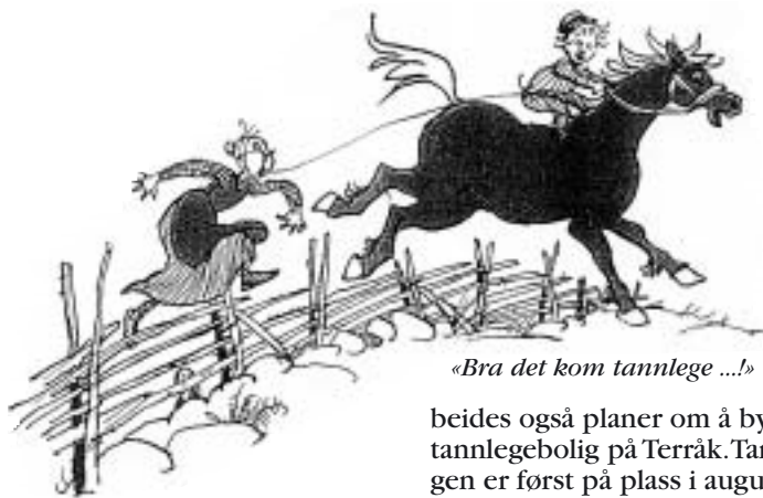
«Bra det kom tannlege ...!»

Vi fortsetter vår serie og prøver å plukke fram små og store begivenheter fra året 1953. Denne gangen har vi funnet fram dette: