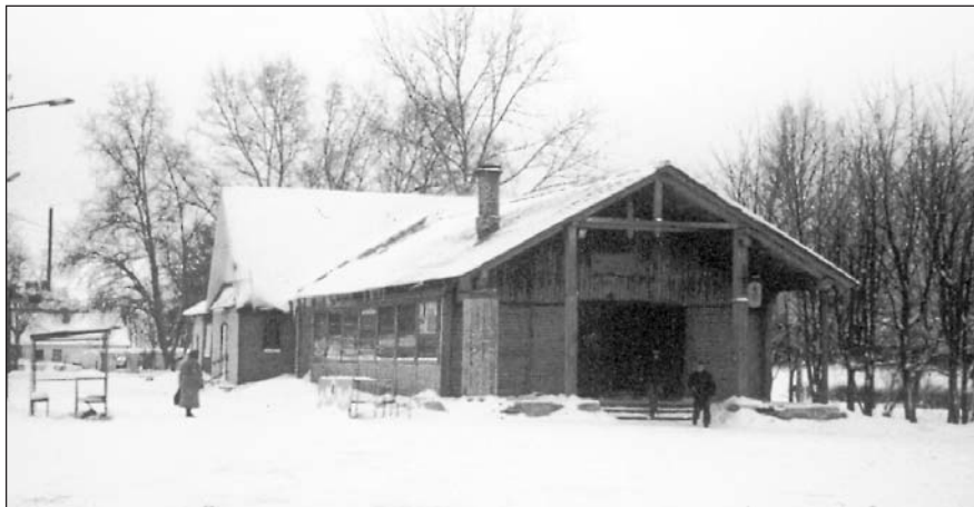
Bybilde fra Ladoga.

De klærne som vi hadde med og ikke delte ut, ble lagt på et lager som kom u n e n h a d d e . K l æ r n e skulle deles ut til de som senere kom og trengte noe. Det var byens sosialkomitee som nå som