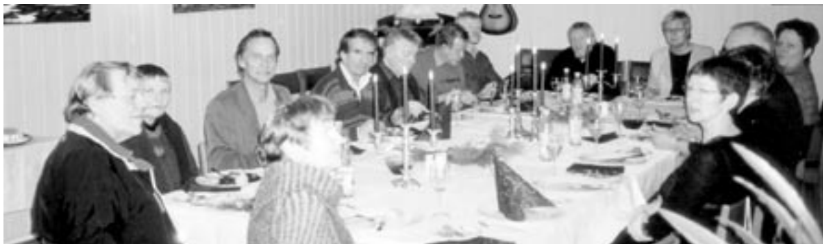
Her er Vassås og Solstad menighetsråd sammen med de ansatte på kirkekontoret, samlet for å takke av for sine 4 år i rådene.