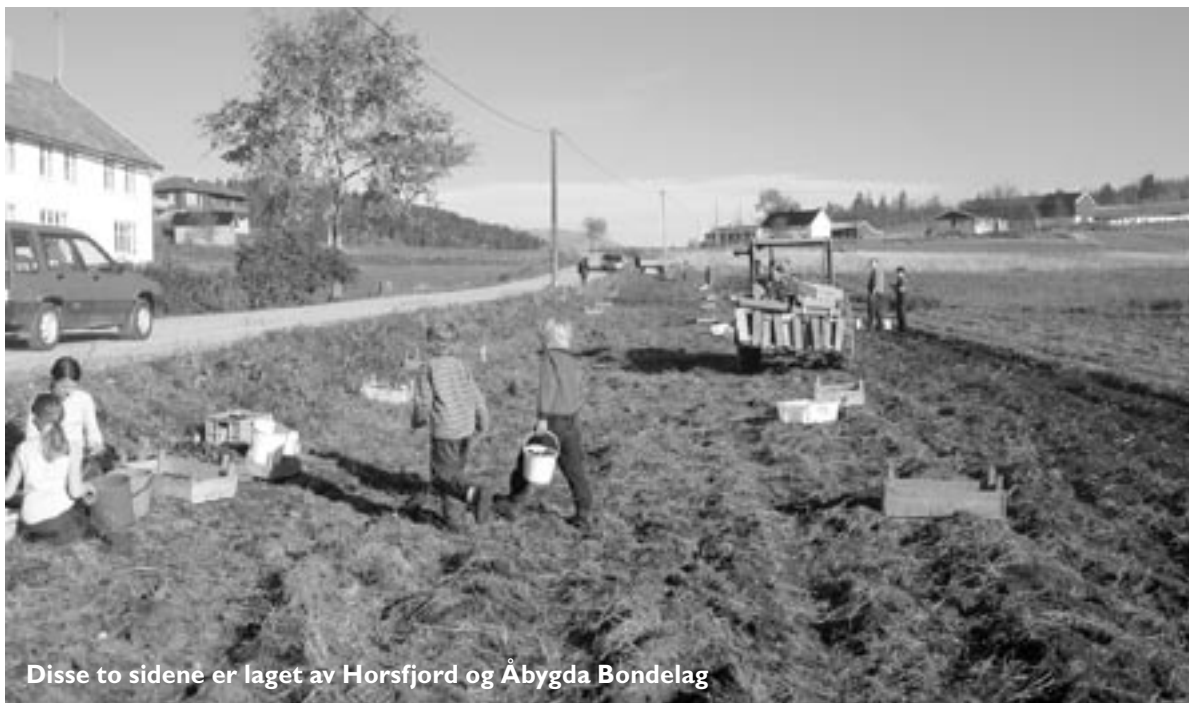
Disse to sidene er laget av Horsfjord og Åbygda Bondelag