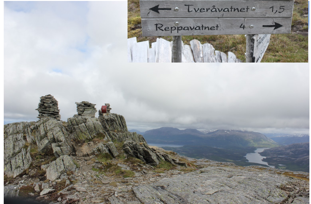
Utsikt nordover mot Heilhornet