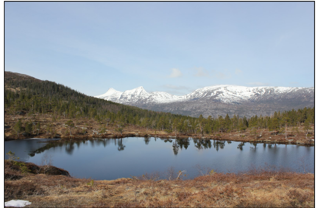
Svartåstjønna med Markahornet og Heilhornet i bakgrunnen.

Turen opp tar ca 40 minutter og passer fint for barn.