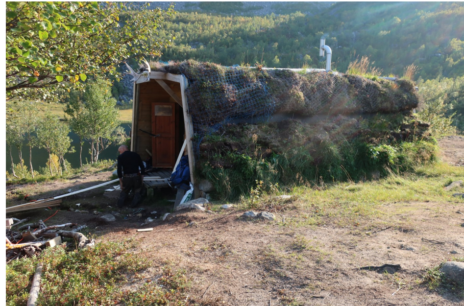
Gundagamma ligger ved Tosktjønnå like nedenfor Grønnbenken.