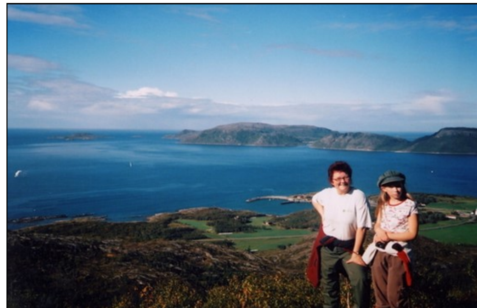
På toppen av Holmshatten