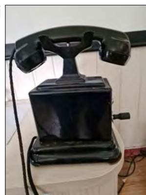
Dette er telefonen som ble slengt ut av hylla og ned på gulvet under lynnedslaget.

Det var ikke alle i bygda som hadde telefon, men vi på Trudvang hadde det. På den tida var det flere på samme linja slik at vi hadde hvert vårt signal. Eks. et kort, et langt og et kort. Telefonen hadde en sveiv som man lagde signalene med. På den tida i 1958 sto vår telefon inne i en innbygd hylle under trappa til loftet. Da tordenværet økte i sin intensitet husker jeg at det var ubehagelig stemning i huset. Så kom det et voldsomt lyn og umiddelbart fulgt av et voldsomt tordendrønn og det var en kraftig smell og hele huset ristet. I sikringsskapet som stod på loftgangen gikk alle sikringer. Telefonen som stod inne i hylla kom flygende ut og ned på gulvet med en smell.