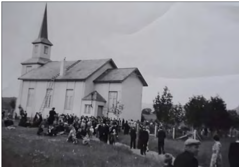
Solstad kirke på Holm, tidlig på 1950-tallet.

Er det flere som ønsker å bidra med historier i menighetsbladet, er det bare å ta kontakt med kirkekontoret.