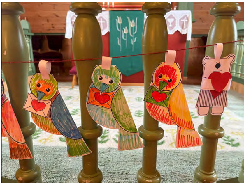
Englebarna hadde pyntet kirka med fargerike figurer.