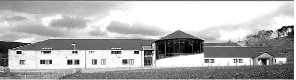
The Ardnamurchan High School ligger i Fort William.