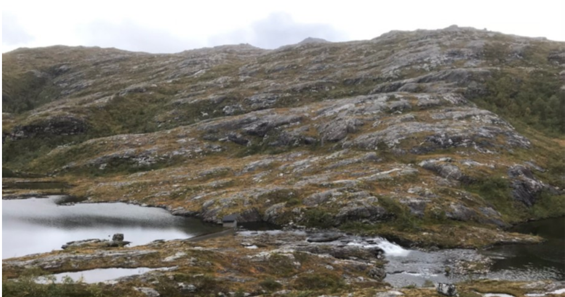
Illustrasjon av tiltaket med damhus. Damhuset vil bli bygget på motsatt side av elven i forhold til illustrasjonen.