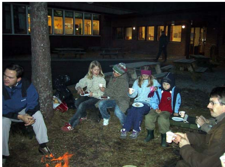
I høstmørket smakte det godt med saft og sjokoladecake rundt bålplassen.