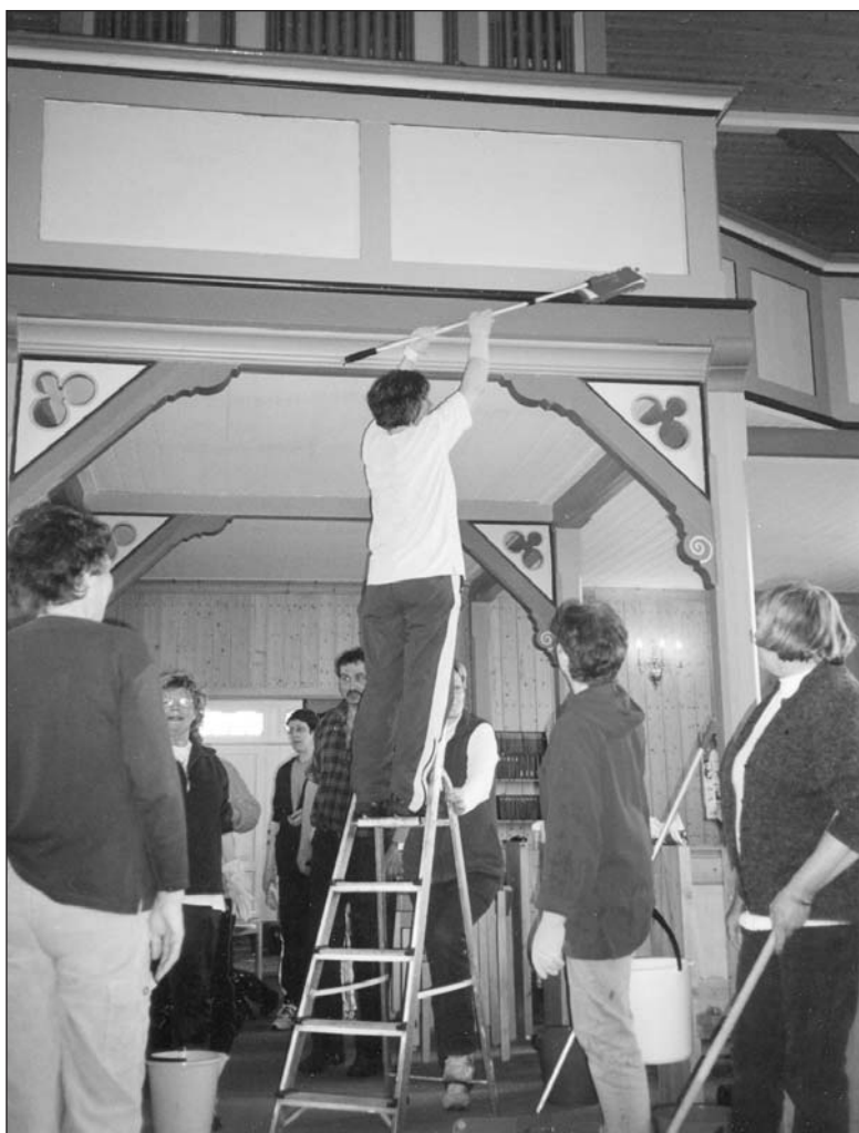
Hele 26 personer møtte opp til rundvask.

Stor takk til de som ofret lørdagen til å gjøre rent i det ærverdige kirkebygget.