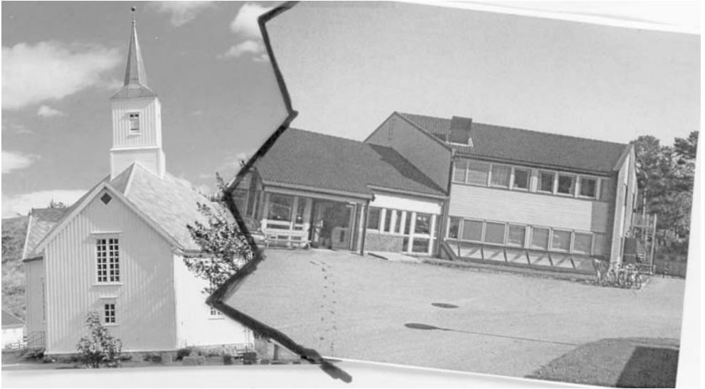
Et nært forestående skille?

senårige historie i vårt land har kirken forandret både organisasjon og konfesjon. Når det nå er tale om forandringer i organisasjonen, forblir den likevel den samme kirke. Læren vil være den samme, oppgavene vil være de samme, og menighetene og medlemmene vil være de samme.