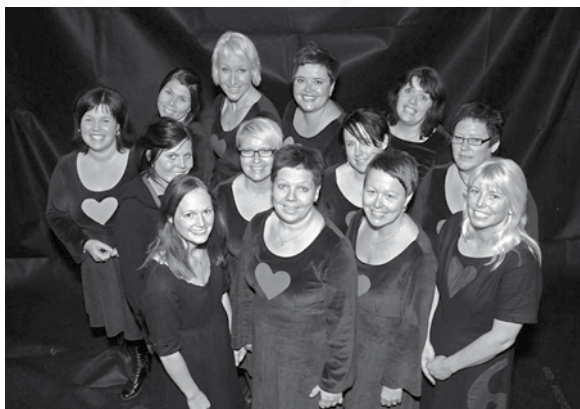
Kviin: Stille damer som lika å søng