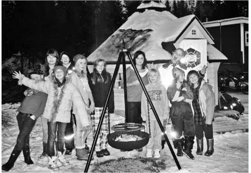
Hatten 4H har mange aktive medlemmer

Klubben arbeider også med en naturmøteplass. Klubbens medlemmer, foreldre og besteforeldre har jobbet med å tilrettelegge, støype fundament, hente, male og sette opp ei grillhytte ved Fuglstad. Grillhytta er kjøpt inn med støtte gjennom Miljøløftet i 4H. Klubben fikk i november 2010 32.000 kroner i extra-midler til utedo og benker. Det skal også kjøpes inn en stjerne-kikkert. Klubben skal arbeide for å skaffe midler til leke/aktivitetsutstyr og informasjonstavle.