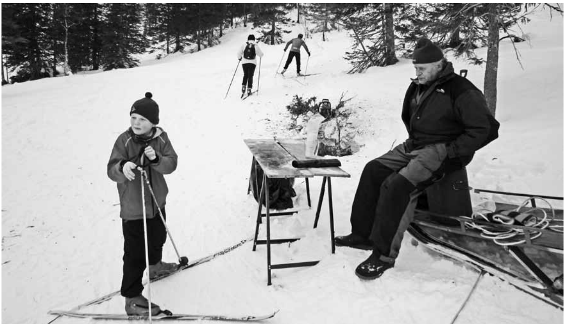
Fra saftstasjonen i Ådalen

Det selges kaffe, brus og mat ved skihuset på Terråk. Der kan man også hente premier.