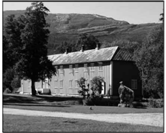
Horstad gård i Åbygda

Komiteen ønsker bindalingene velkommen til en forhåpentligvis inspirerende dag.