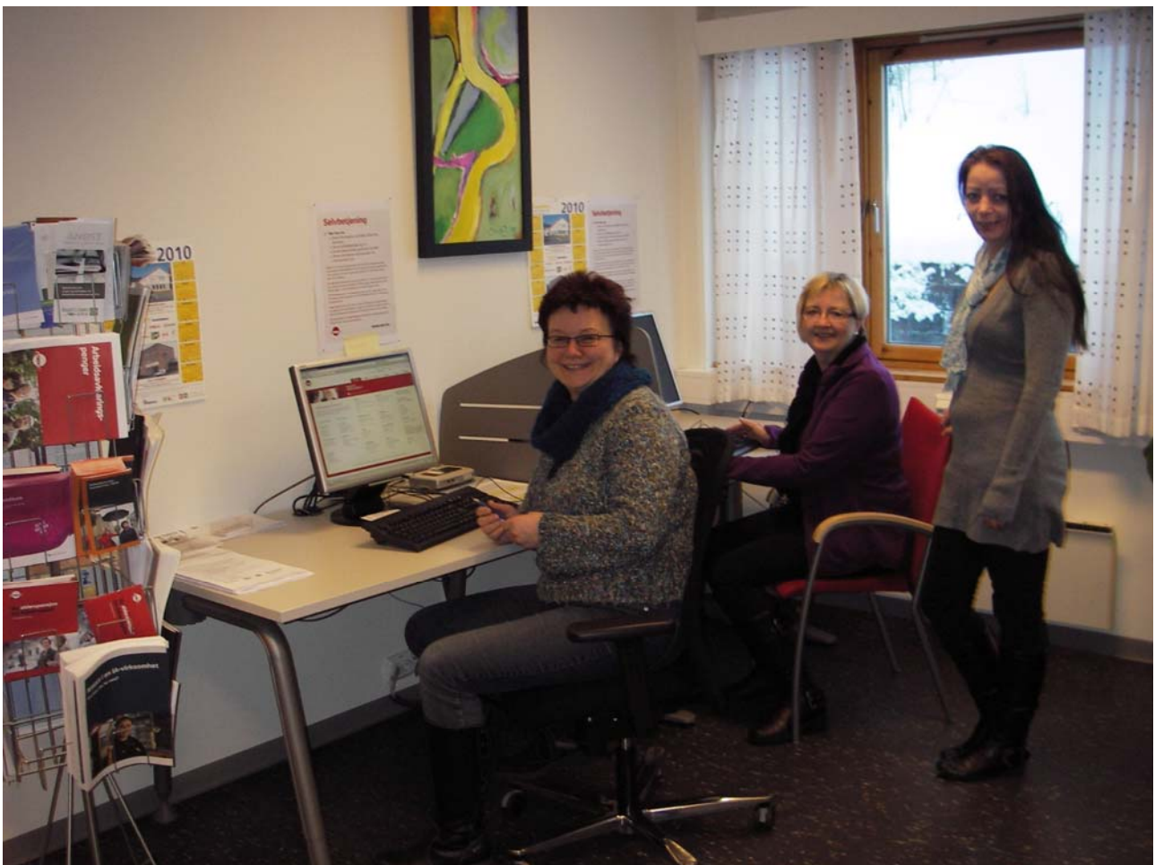
Damene på NAV