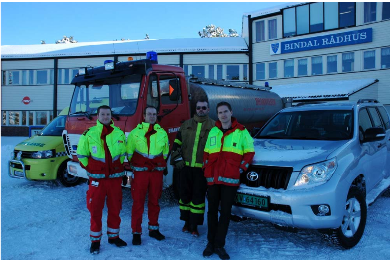
Ambulanse, brann og lege - samhandling