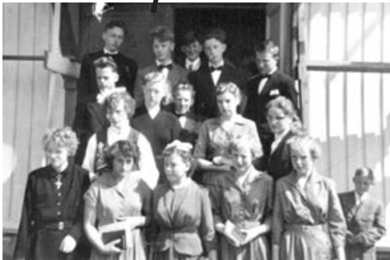
Konfirmantene i Solstad 1956.