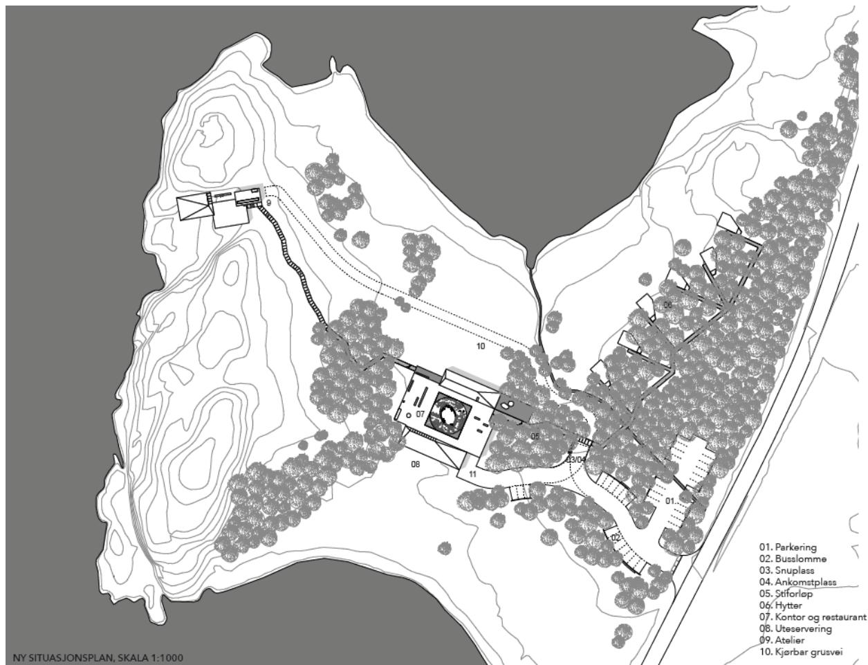
Figur 2. Situasjonsplan

Peacepainting Center skal bli et kunst- og fredssenter uavhengig av tro og livssyn. Planen skal også tilrettelegge for en småbåthavn på den nordlige delen av planområdet, med mulighet for en molo på mellom 20 og 30 meter. Figur 2 viser er foreløpig situasjonsplan, denne inkluderer ikke skisse av molo.