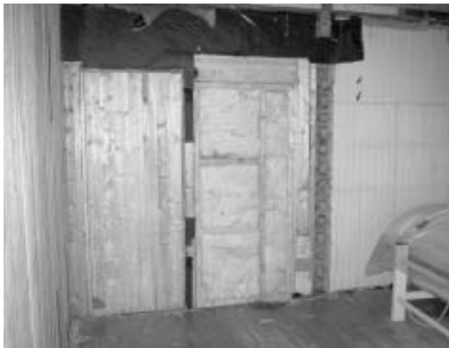
Panel og golv ble åpnet for å tørke opp bygningen etter vannlekkasje som oppstod på nyåret.

En vannlekkasje i nyttårshelga har gjort skader på Doktorgården. Deler av huset har vært avstengt noen uker mens Systemhus har reparert skadene.